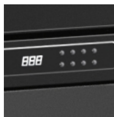
Régulation électronique Touch Screen, avec sécurisation des commandes et fonction Energy saving