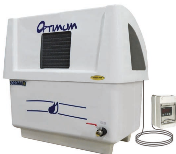
boîtier de commande à distance avec 5 mètres de câble