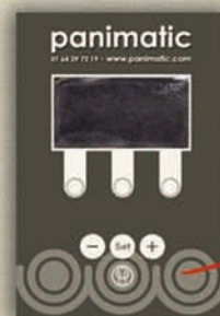
Tableau pour fonctionnement en chocolat

Tableau pour fonctionnement en réfrigéré